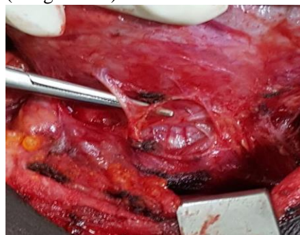
Figure N°4 : Dissection chirurgicale du Nerf Laryngé recurrent, ici en position retro vasculaire