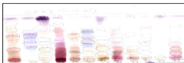
Figure 1 : Chromatogramme des extraits infusés, décoctés et macérés des 4 plantes, révélé avec le réactif de Godin.

Pour l'activité antioxydante nous avons utilisés les extraits décoctés et infusés ; le BAW (65:15:25) comme éluant. Après migration, les chromatogrammes obtenus avec les quatre (4) extraits, ont été pulvérisés avec une solution à 2% de DPPH dans le méthanol. Les composés actifs apparaissent comme des tâches jaunes sur fond violet. Les figures 1 et 2 donnent les chromatogrammes des extraits des 4 plantes élués dans le BAW (65:15:25) et révélé au Godin puis au DPPH.