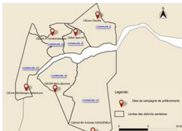
Figure 1 : Carte de Bamako avec les sites de campagnes de prélèvement

Du 29 Octobre au 17 Décembre 2022, l'Association des Jeunes Laborantins du Mali (AJLM) récépissé, N° 0107/2022/ G-DB a organisé des campagnes de dépistage dans les six communes du District de Bamako et dans une banlieue à environ 30 km de la ville de Bamako, au Mali. Il s'agissait d'une étude transversale dans les communes suivantes : commune I, BACONI (centre santé Cherifila), commune II (Centre de Santé de Référence sans fil), commune III, (ASACOTOM Tomikorobougou), commune IV, (CSCOM Sibiribougou à Sébénikoro), commune V, (CSCOM Bakodjikoroni), commune VI (Dianeguella, cabinet BA Aminata) et Farabana (CSCOM Farabana) à environ 30 Kilomètre (Km) de Bamako, voir figure 1.